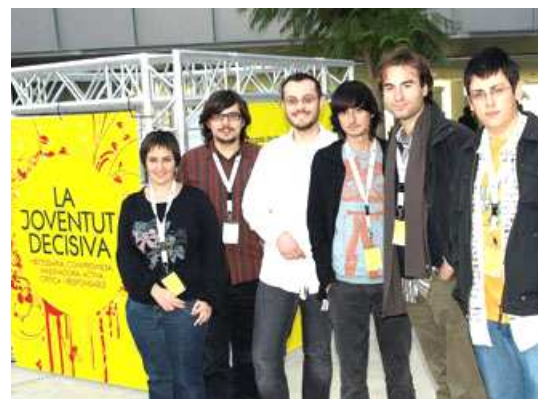
El col·lectiu de joves d'El Prat va donar tot el suport al XV congrés nacional de la JNC.

Els passat novembre es va celebrar a la nostra ciutat el XV Congrés de la Joventut Nacionalista de Catalunya. El col·lectiu d'El Prat va comptar amb la presència de quatre delegats que, repartits en tres ponències diferents, van poder traslladar als militants d'arreu del territori les diferents esmenes presentades, que varen servir per a que la nostra vila i digués la seva en la construcció del país en infraestructures tan properes a nosaltres com el port i l'aeroport. Aquest acte, al que van assistir personalitats de tots els partits, va ser clau per a que El Prat, com a poble, deixés marca en el si de la JNC i la seva visió política; com a col·lectiu local va servir per enfortir aquest, de recent creació.