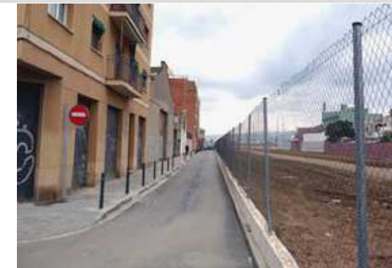
Proposta de l'Ajuntament d'El Prat

Des de l'oposició fiscalitzem l'actuació de l'equip de govern ICV-PSC, però també fem propostes, moltes de les quals acaben duent-se a terme, aquí les anirem explicant i contrastant, amb l'objectiu de millorar la nostra ciutat.