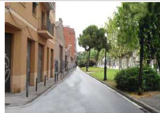
Proposta de CiU per al C/. Ferrocarril